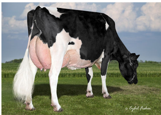
COOKIECUTTER MOG HANKER THIRD DAM

GLPI +3180 PRO$ 1951 DPF RDF BLF CNF BYF MWC CVF HH1F HH2F HH3F HH4F HH5F HH6F HCDF HMWC