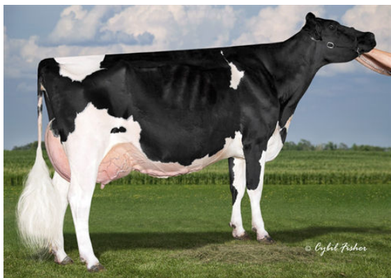
COOKIECUTTER MOG HANKER THIRD DAM